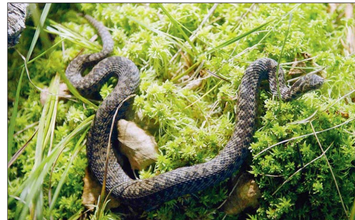
CENTRE DU BUGNON Deux terrariums et des photos font connaître la vipère péliade, le reptile le plus rare du canton.

L'expo sur la vipère péliade, qui, dans le canton, ne vit plus que dans les marécages de la vallée des Ponts-de-Martel, s'est ouverte hier au centre du Bugnon (lire notre édition de lundi). Quinze classes des environs la visiteront d'ici à vendredi pour se familiariser avec elle. Le public pourra la voir sa-