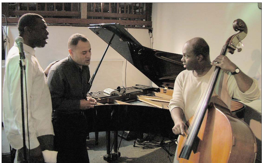
«RETOUR À GORÉE» Le chemin du jazz passe par ce lieu hanté par une histoire tragique. (SP)