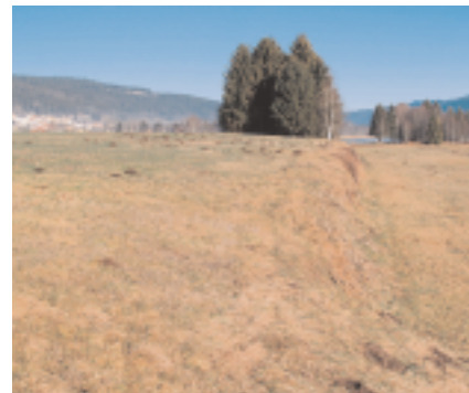
In Ponts-de-Martel Torf wurde während langer Zeit Torf zum Heizen und für den Gartenbedarf abgebaut.

Seit mit der Rothenturm-Initiative Hochmoore in der Schweiz unter Schutz gestellt wurden, ist der Torfabbau – der in Ponts-de-Martel von Bauern und drei