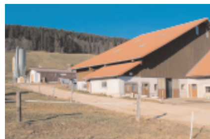
Nur zwei Betriebe in Ponts-de-Martel halten Geflügel im grösseren Rahmen.