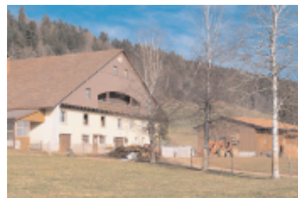
Vielorts wurden die bestehenden Ställe zu Laufställen umgebaut.