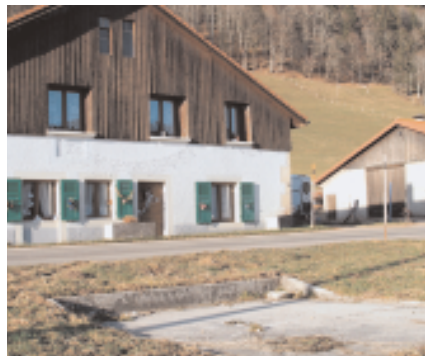
Oft trennt die Strasse den Hof von der (ehemaligen) Mistplatte, hier im Weiler Petit-Martel.

Die Zahl der Milchproduzenten ist so von 31 im Jahr 1991 auf heute 21 gesunken. Damals fusionierten die drei lokalen Käsegenossenschaften „Com-