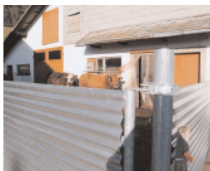
Windschutz in einem Laufhof in Petit-Martel: Die strengen Winter machen besonderen Schutz nötig.

bes-Dernier“, „Petit-Martel“ und „Ponts-de-Martel“ zur Milchgenossenschaft „Martel“. Die dezentralen drei Käsereien auf dem Gemeindegebiet wurden geschlossen, die neue Schaukäserei im Zentrum gebaut.