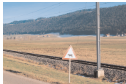
Der Bach in der Talmitte trennt Ponts-de-Martel von der Gemeinde Brot-Plamboz.