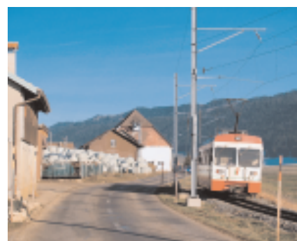
Seit 1899 ist das Tal mit La Chaux-de-Fonds verbunden. Von und nach Le Locle gibt es eine Busverbindung.

Industriebetrieben bis in die 1980er Jahre betrieben wurde – als Betriebszweig weggefallen. In den Schuppen zur Trocknung der „Boudins“ (Torf-Briketts, die Blutwürsten, boudins, ähnlich sehen) wird heute Holz gelagert oder Gerät versorgt. Nur ein ausgeschilderter Rundgang im Moos, verfallende Torfhütten und verrostete Schienen erinnern an die Torfzeit in Ponts-de-Martel.