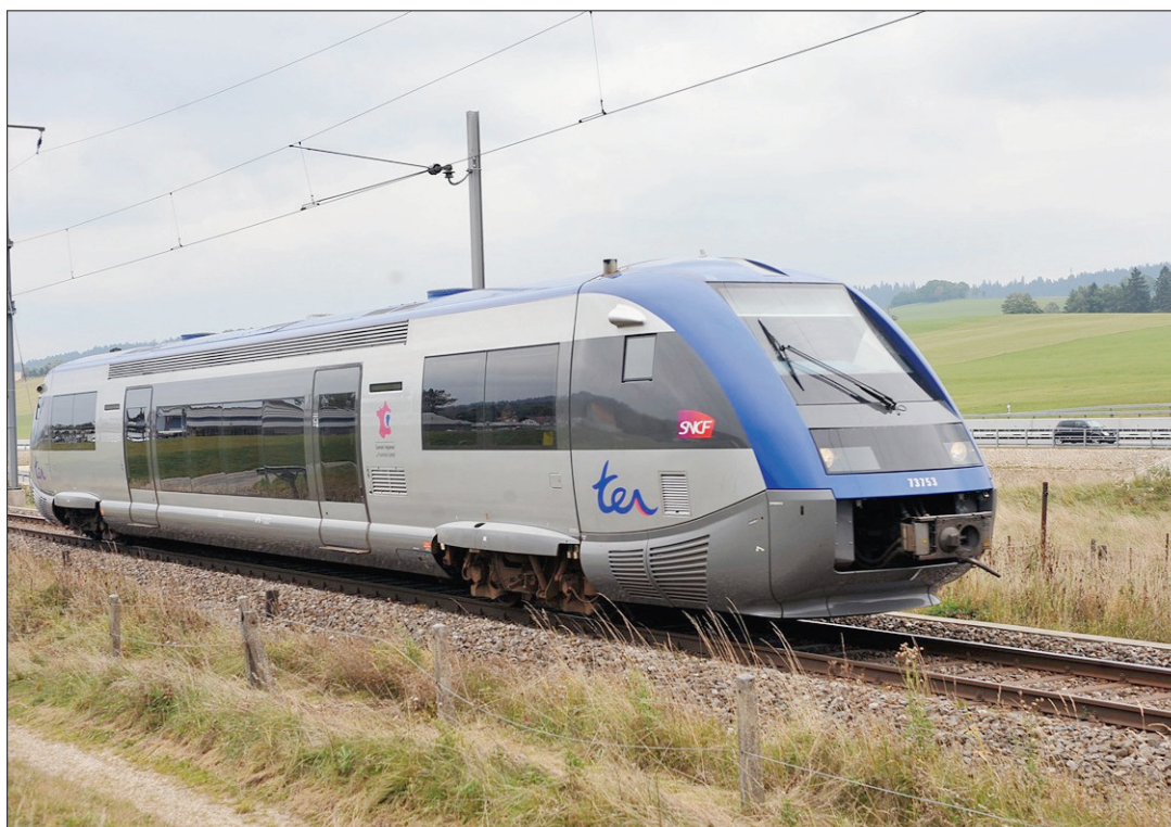
TRAIN Le développement de la ligne ferroviaire Bienne-Besançon, qui passe par La Chaux-de-Fonds, est l'une des priorités du Conseil communal.

La volonté affirmée du Conseil communal de revaloriser l'image de La Chaux-de-Fonds (notre édition du 24 mars) a trouvé un écho des plus favorables auprès du législatif. Mais cela ne sera possible qu'en intégrant les habitants de la cité à cette réflexion, ont souligné plusieurs élus. «La po-