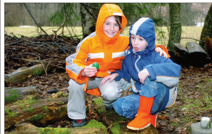
COURSE AUX ŒUFS Les animations de Pâques du Musée paysan sont toujours fort appréciées.

Samedi et dimanche prochains, de 14h à 17h, le Musée paysan de La Chaux-de-Fonds invite tout un chacun, et spécialement les enfants, à partager de bons moments à l'enseigne des traditions Pâques à la ferme. Quel que soit le temps, une chasse aux œufs aura lieu les deux jours. Une exposition de Pâques sera installée dans l'écurie (œufs décorés, poules et lapins en tous genres) avec un concours à la clé. Il s'agira de répondre à quelques questions liées à l'exposition.