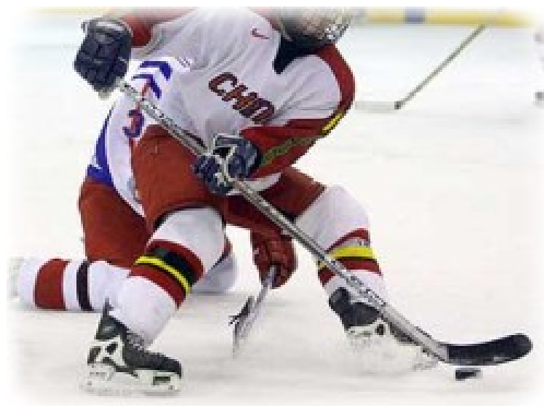
HC Les Ponts