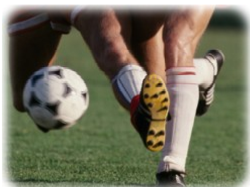
FC Les Ponts