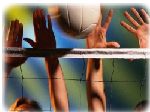
VBC Les Ponts